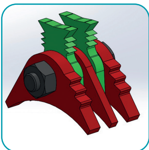
Cuchilla Ref. 014962